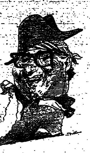
« القنصان » هنري كينجر

زار بافل ميتشكو المراسل الخاص لـ«السيدي» في البرانس، في الشرق الأوسط، في وقت ليس بلبسده، وهو يكتب في هذا المقال من زيارته للسويس والقنيطرة، وحين سياتي في الارض المحروقة التي يتنهدا فيها السويين اللبنانيين في جنوب لبنان، وفي كل مكان ذهب اليه برانسال «البرانس» رأى آثار الحوان الاسرائيلي الناتج من الهجومات، والذي يتصل بمسؤوليته تامة اسرائيل، وقد ختم بافل ميتشكو مقاله على النحو التالي: